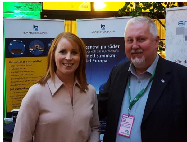
Centerpartiets kommundagar i Göteborg

Du hittar Trafikverkets facebookside genom att söka på Norrbottenstrafikverket.